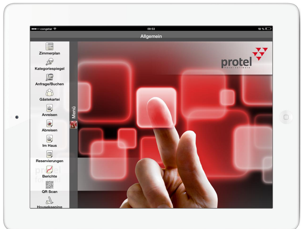
Der protel for iPad-Startbildschirm mit geöffnetem Menü: Alle Funktionen auf einen Blick.

Die klare übersichtliche Oberfläche macht das Arbeiten mit protel auf dem iPad zur Freude und auch für ungeübte Benutzer zur einfachen Fingerübung.